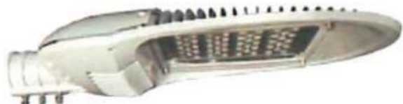
サイドポール仕様